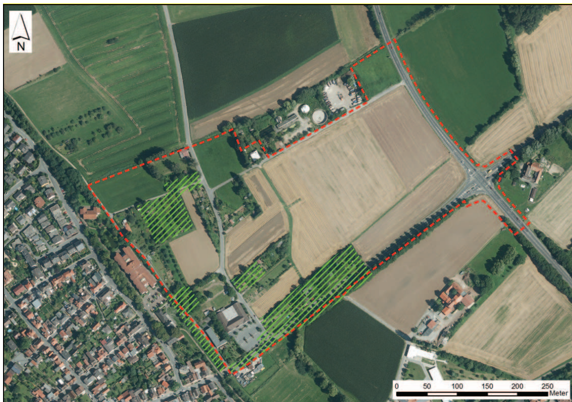
Abbildung 3: Bevorzugte Jagdgebiete der Zwergfledermaus und des Kleinen Abendseglers

EHZ = Gesamtbewertung des Erhaltungszustandes in Hessen (grün = günstig; gelb = ungünstig – unzureichend; rot = ungünstig – schlecht, xx = unbekannt) (HESSEN FORST FENA 2009)