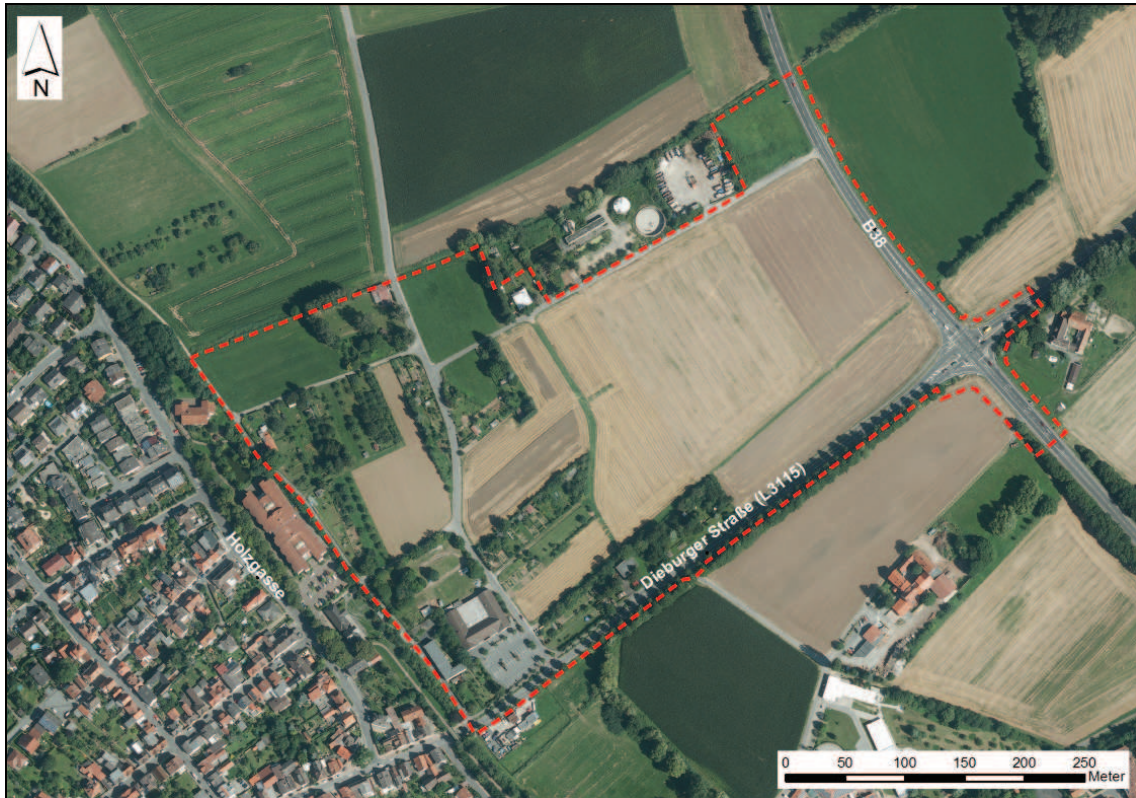
Abbildung 2: Geltungsbereich des B-Plans, welcher gleichzeitig auch das Untersuchungsgebiet für den vorliegenden Fachbeitrag darstellt.

Der überwiegende Teil des Untersuchungsgebiets ist landwirtschaftlich genutzt. Im zentralen Bereich des Gebiets liegen Äcker, im Südwesten befinden sich Kleingärten (u.a. mit Zierrasen sowie heimischen und nicht heimischen Sträuchern und Bäumen) sowie ein Supermarkt mit Parkplatz. Heckenstrukturen finden sich besonders im westlichen Teil des Untersuchungsgebiets. Außerdem ist die Fläche durch kleinräumige Obstwiesen und Gehölzbestände charakterisiert (Karte 1).