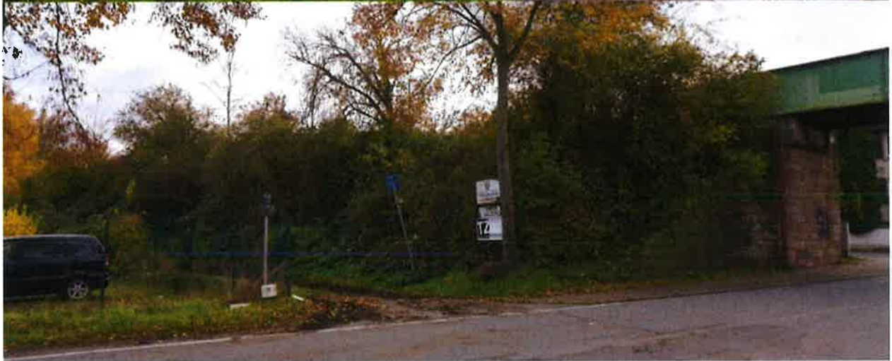
Bild oben: so ist es heute. Wir meinen: Indiskutabel. Bild unten: dieser Matschweg könnte asphaltiert eine ideale Erschließung für das BHZ sein. Nur wann?