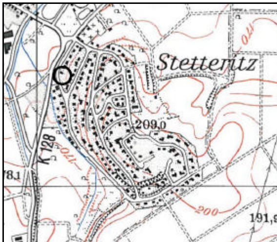
Abbildung 1: Lage des Plangebietes (o.M.)

Die Grenze des räumlichen Geltungsbereiches der Bebauungsplanänderung wird durch die zeichnerische Darstellung bestimmt.