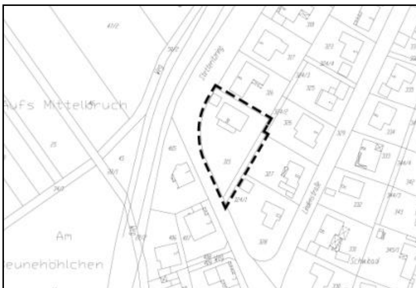
Abbildung 2: Räumlicher Geltungsbereich der Bebauungsplanänderung (o.M.)