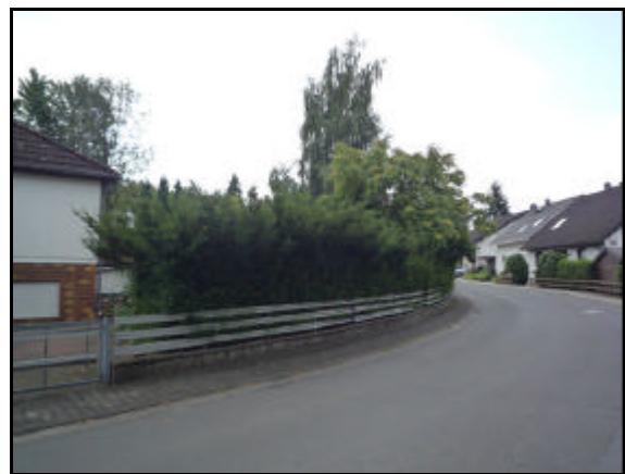
Abbildung 6 und 7: Bestehende Bebauung im Plangebiet